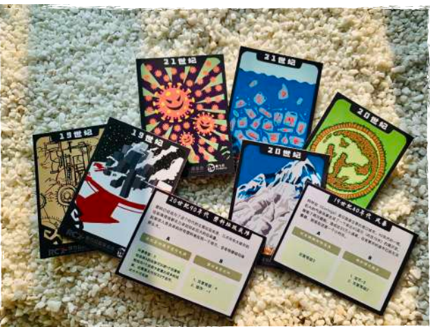
特此感谢斯芬克艺术留学机构的学生们协助设计卡牌

三款游戏均已完成了开发和试玩环节，将通过大学生生态支教等活动，普及给更多特别是中西部地区的中小学校。