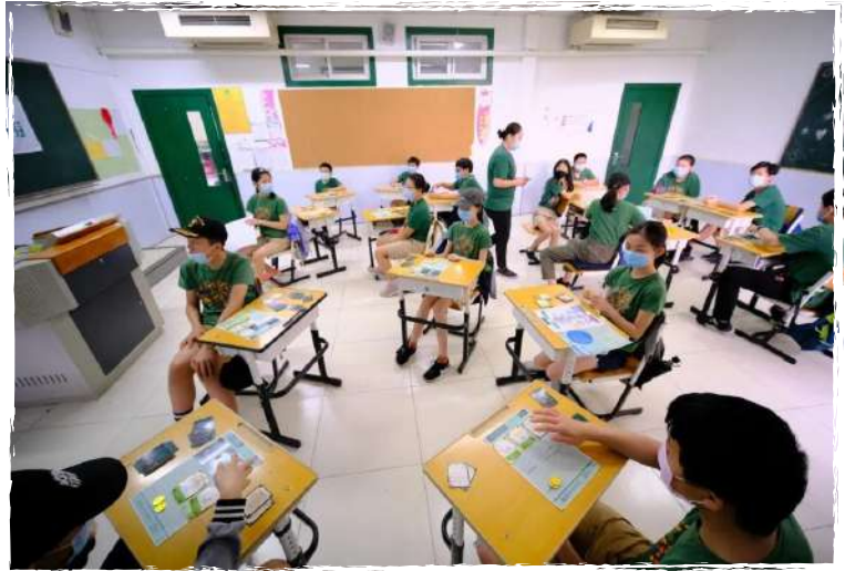
学生参与4A氟石牛仔裤游戏试玩

成立二十多年来，根与芽一直在创新开展环境教育的形式。在我们看来，大部分孩子并不缺乏环境保护相关的知识或讯息，更重要的是如何引导他们去做出改变。2020年，在北京接力基金会的支持下，根与芽联合深圳老马等人公司针对小学高年级学生创新了环境教育桌游课程，开发了4A氟石牛仔裤、0.2m 2 垃圾填埋场、星球改造三款桌游课程。